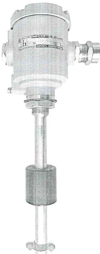
Рисунок 1 - Общий вид преобразователя

Сокращённое условное обозначение и заводской номер преобразователя наносятся на информационную табличку, размещенную на корпусе преобразователя.